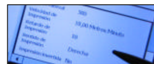
Controllo totale da qualsiasi PDA